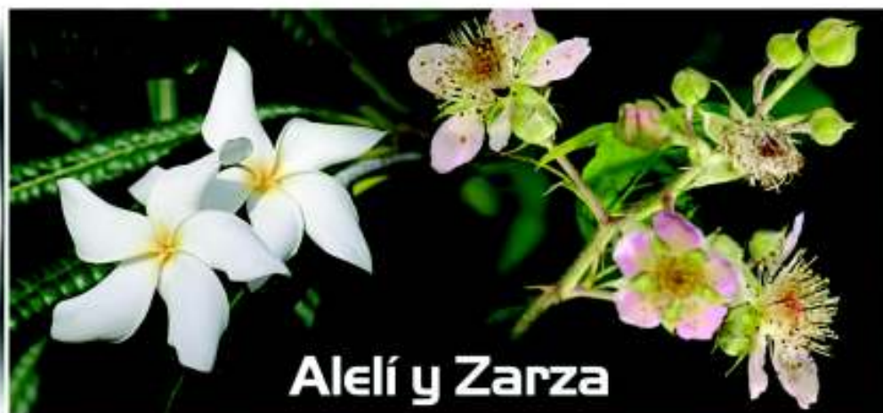
Alelí y Zarza

por ella, tienes que encogerte en un acto obligatorio de reverencia ante su majestad. Al entrar, su exigencia es recompensada con el ofrecimiento de un salón espacioso con techo en forma de cúpula, que centraliza un tragaluz por donde, a su vez, fluye el aire llenando de frescura su recinto. El encuentro con lo divino es puro allí. En esa sala amplia y natural se congregaron nuestros indios y más recientemente los pioneros modernos de mi barrio para refugiarse de las tormentas y los huracanes.