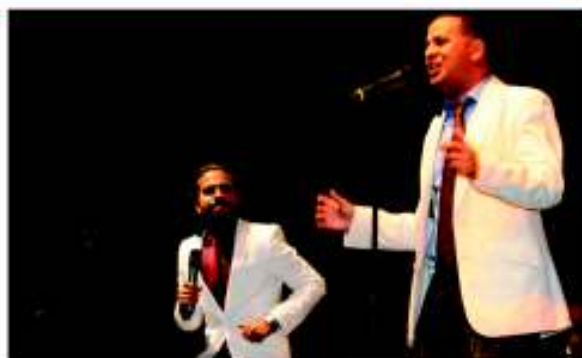
Los jóvenes NG2